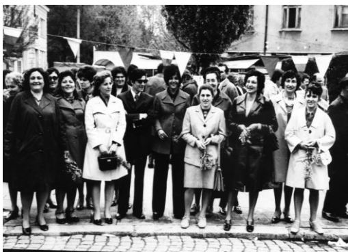
Снимка: диск 2 №13 БИБЛИОТЕКАРИ

Тяхното всекидневие ни е потребно винаги. И когато сме край машините. И в минути на отмора. И в съсредоточени дни пред изпит. И за повишаване на квалификацията.